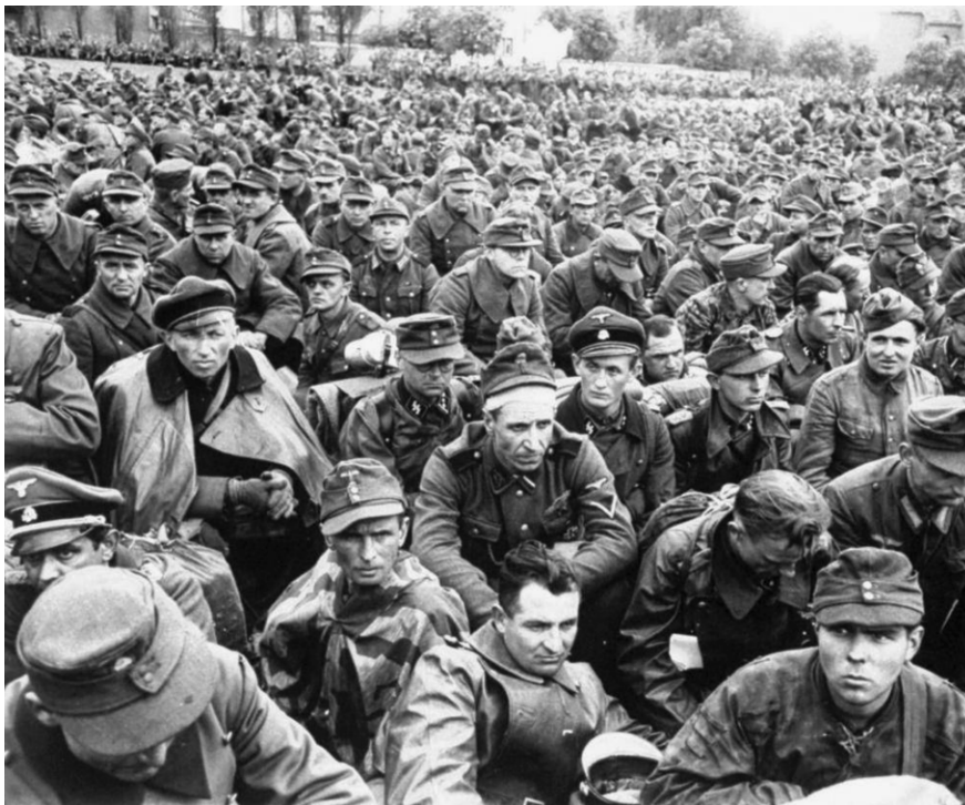
Foto van Duitse krijgsgevangenen van de westerse geallieerden. Deze gevangenen zijn opgesloten in Rheinwiesenberg , waar tussen april en oktober 1945 meer dan een miljoen gevangenen verblijven: